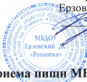
График посещения мест приема пищи МБДОУ Ерзовский ДС «Ромашка» комиссией, осуществляющей родительский контроль